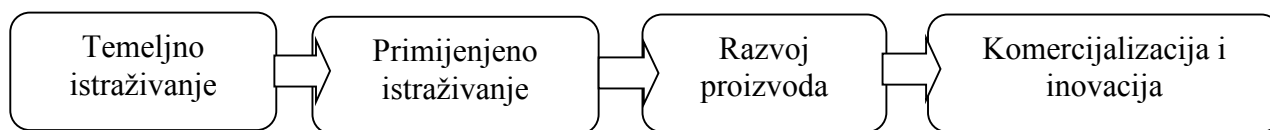
Slika 1. Linearni model inovacija [1]

više istraživačkih (R&D) aktivnosti će uzrokovati više inovacija i povećati inovativnost gospodarstva.